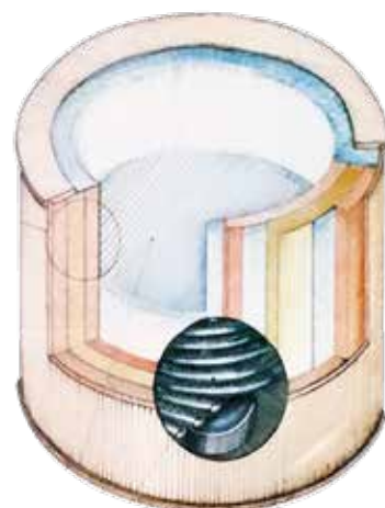
Accumulatore Orgonico modificato da W. Reich