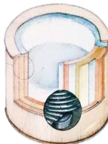
Organic Accumulator modified by W. Reich