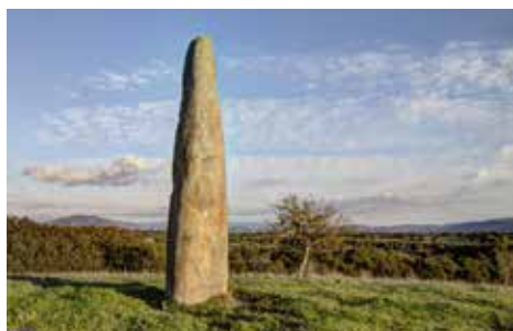
La Valle dei Menhir Villa Sant'Antonio, Oristano, Sardegna.

Sia popolazioni antiche in parte scomparse, sia altre ancora esistenti, hanno testimoniato la veridicità del fenomeno “Geobiologico” . I Celti, i Romani, gli asiatici, ed in special modo i Cinesi, da sempre rispettosi delle loro tradizioni (vedi il Feng Shui ) ci confermano quanto si dice in merito alle energie sottili della terra e del cosmo. Noi occidentali abbiamo definito, nel nostro linguaggio, come “zone geopatogene”, i fenomeni vibrazionali che condizionano lo stato di salute nel corpo.